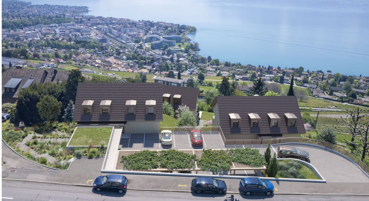
bâtiment B // lot 6

Toute place de stationnement intérieur supplémentaire est au prix de 50'000 CHF.